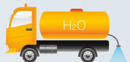
Нега и очвршћавање